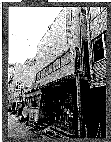
内海（東京学院ビル）