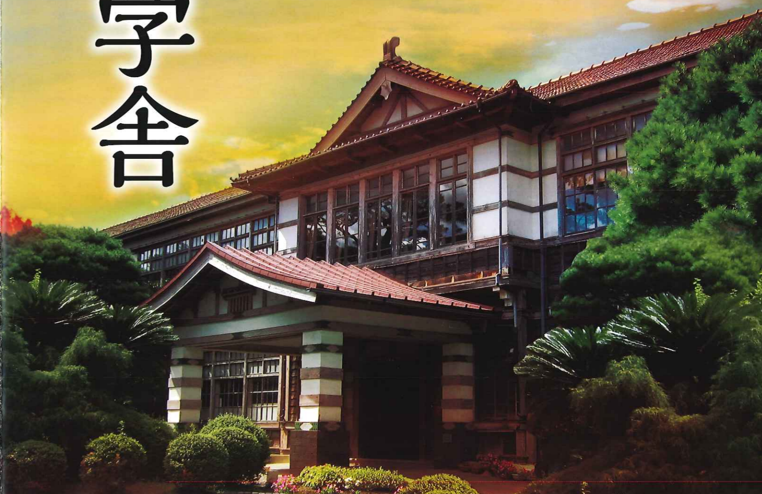
旧明倫小学校本館 Old Meirin Elementary School Main Building (旧萩藩校明倫館跡) (Meirinkan Hagi Domain School)