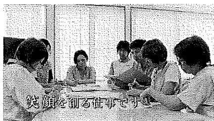
①笑顔を作る仕事です