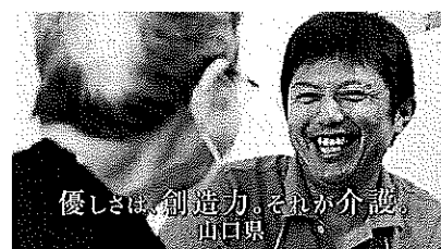
⑤優しさは、創造力。それが介護。